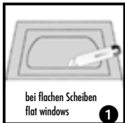
bei flachen Scheiben flat windows